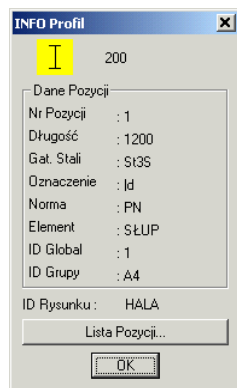
Rys. 1. Okno dialogowe Info Profil

W odpowiedzi można wskazać tylko profil lub zestaw śrubowy. Inne obiekty są odrzucane przez program. Jeżeli wybór okaże się poprawny, to wyświetlane jest niewielkie okno, w którym pokazane są wszystkie odczytane ze wskazanego obiektu informacje. Znaczenie tych informacji i ich charakter przedstawiono w punkcie „Informacje dopisywane do obiektów rysunkowych”.