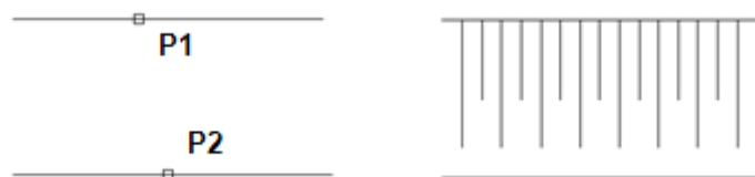
Rys. 1. Rysowanie skarpy w widoku z boku