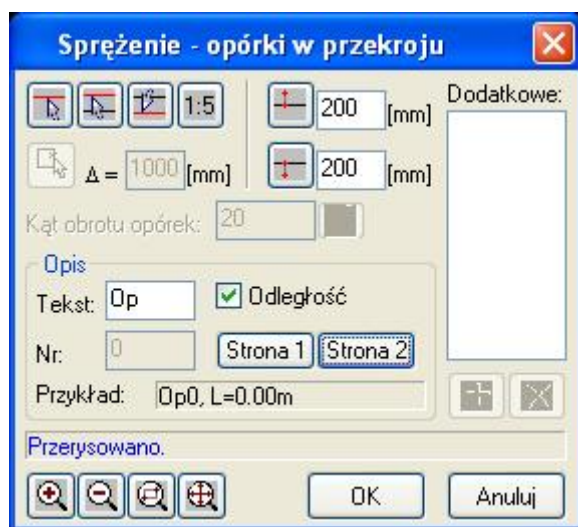
Okno dialogowe Opórki w przekroju

Polecenie służy do rysowania opórek we wskazanym przekroju podłużnym. Podstawą do rysowania są tutaj narysowane wcześniej opórki z góry. Po wskazaniu opórek w widoku z góry, polinii przekroju oraz bazy pojawia się okno dialogowe Opórki w przekroju , w którym użytkownik może dokonać zmian odnośnie sposobu rysowania. Opórki w przekroju rysowane są równoległe do osi Y lokalnego układu współrzędnych. Opis okna jest identyczny jak w poleceniu Opórki z boku – jedyna różnica polega na tym, że niektóre kontrolki są zablokowane.