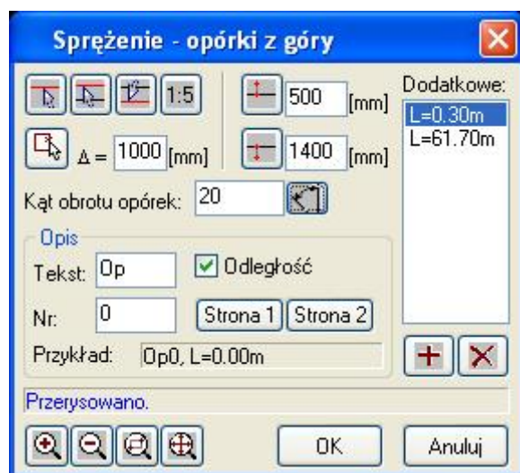
Okno dialogowe Opórki z góry

Polecenie służy do rysowania opórek w widoku z góry. Po wskazaniu bazy, na której mają zostać narysowane opórki pojawia się okno dialogowe Opórki z góry , w którym użytkownik może dokonać zmian odnośnie sposobu rysowania. Opórki w widoku z góry rysowane są prostopadłe lub pod określonym kątem \alpha do bazy. Opis okna jest identyczny jak w poleceniu Opórki z boku.